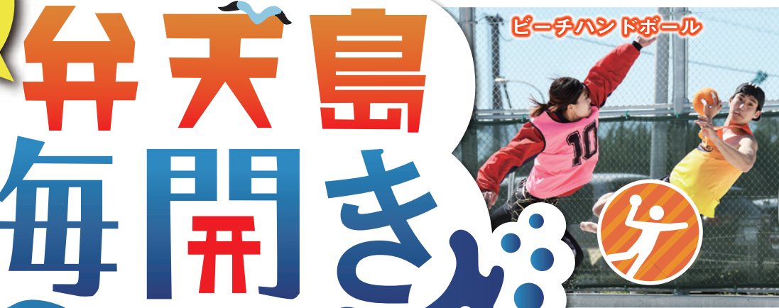
ビーチハンドボール