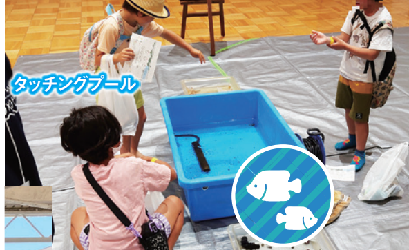
タッチングプール