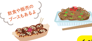
飲食や販売の ブースもあるよ

詳しくははまなご夏フェスタ HP を参照ください (内容が一部変更になる場合があります)