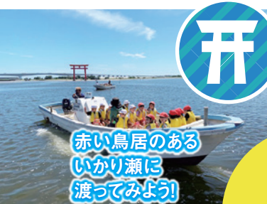
赤い鳥居のある いかり瀬に 渡ってみよう!