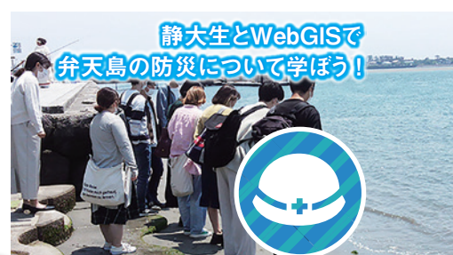
静大生とWebGISで 弁天島の防災について学ぼう!